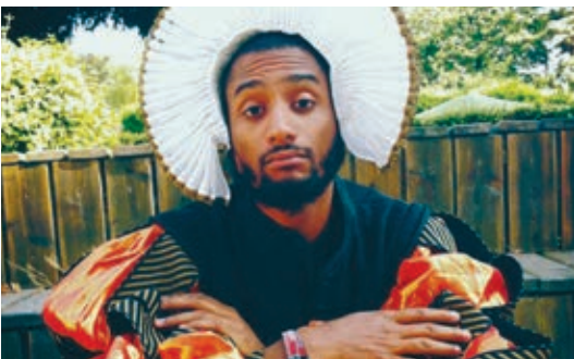
© Jackie Pall - Theater Group

samedi 1 er mars Nouveau theatre de Montreuil / Maison de l'arbre