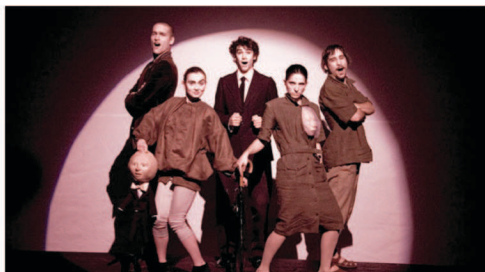
Funérailles d'hiver

Deux familles sont réunies pour célébrer un mariage quand l'éruption d'un cousin porteur de mauvaises nouvelles fait exploser la cohésion du groupe. Un texte de Hanokh Levin, important auteur israélien encore peu joué en France.