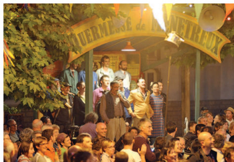
La Quermesse de Ménétreux © Sylvie Monier