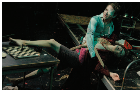
The Wooster Group's Vieux Carré

Le Wooster Group, collectif américain mythique, s'empare d'une pièce peu connue et autobiographique de T. Williams, récit violent, fou, parfois scandaleux, du passage à l'âge adulte d'un jeune homme qui s'éveille à l'homosexualité.