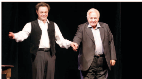
Jules et Marcel

Une amitié entre deux monstres du cinéma, Pagnol et Raimu, incarnée par deux sacrés acteurs, Galabru, qui a tout joué, du gendarme au boulanger, et Caubère, enfant du Soleil, auteur et metteur en scène.