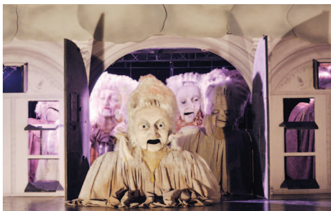
Le Bal des ingrates